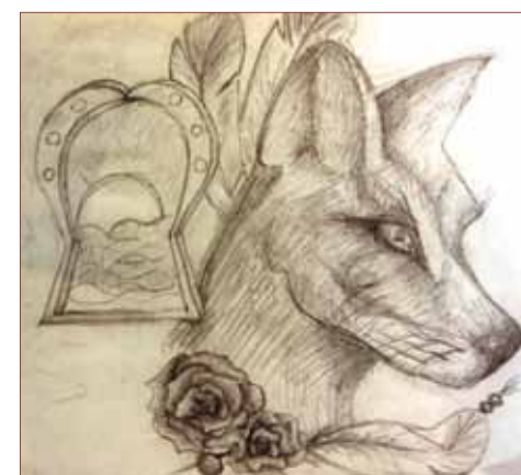
рисунки Виктории Жулкевской